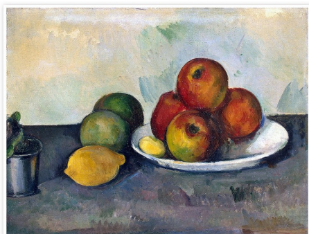
Nature morte avec pommes

témoignent de sa quête constante pour représenter la nature et la réalité de manière plus profonde et plus structurée.